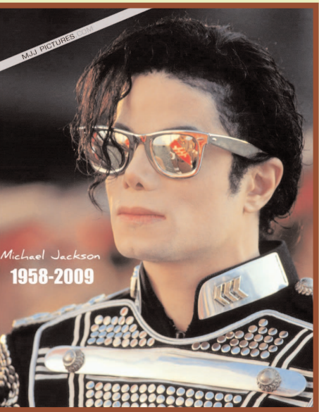
Michael Jackson 1958-2009

ൽക്കരിക്കുന്ന വിധികർത്താക്കളും നമ്മുടെ നാട്ടിലും നിറയുന്ന ഈ കാലത്ത് കുട്ടികളുടെ മനസ്സിന്റെ സമ്മർദ്ദങ്ങൾക്ക് ആരെങ്കിലും കാതോർക്കാനുണ്ടോ? ജാക്സനെപ്പോലെ ബാല്യം നിഷേധിക്കപ്പെട്ട ഒരു കുട്ടി പ്രശസ്തിയുടെ-അതേത് തരത്തിലുള്ളതായാലും-മരീചികയ്ക്കു പിറകെ ലക്കും ലഗാനുമില്ലാതെ ഓടിയതിന് മറ്റൊരു ന്യായീകരണവുമില്ല. പ്രശസ്തിയല്ലാതെ മറ്റൊന്നും അങ്ങനെയൊരാൾക്ക് കാംക്ഷിക്കാനില്ലെന്നതാണ് സത്യം. പണവും സുഖസൗകര്യങ്ങളും വേണ്ടുവോളമുണ്ടല്ലോ. മ്യൂണിച്ച് ലെ ഹോട്ടൽ മുറിയുടെ ബാൽക്കണിയിൽനിന്ന് തന്റെ കൊച്ചുകുഞ്ഞിനെ തൂക്കിപ്പിടിച്ച് ആരാധരെ അമ്പരപ്പിച്ചതും തനിക്ക് വിശ്വസിച്ചിട്ടുണ്ടാകാൻ പറ്റിയത് ബബ്ബിൾ എന്ന ചിമ്പാൻസി മാത്രമാണെന്ന് വേദനയോടെ മനസ്സിലാക്കുന്നതും മൈക്കിൾ ജാക്സൺ എന്ന ഒരിക്കലും വളരാത്ത ആ കുട്ടിതന്നെയാണ്. അവസാനകാലത്ത് ഏതാണ്ട് തന്റെ തല്ലാതായി മാറിയ നെവർലാൻഡ് റാഞ്ച് എന്ന വിഭ്രാന്തകലോകത്ത് ജാക്സൺ തനിച്ചായിരുന്നെന്നു തന്നെ പറയാം. ഈ ഭൂമിയിൽ കുട്ടികളുണ്ടായിരുന്നില്ലെങ്കിൽ തന്റെ നിലനില്പിനുമുന്നെ ന്യായീകരണമുണ്ടാവുമായിരുന്നില്ല എന്ന് മൈക്കിൾ ജാക്സൺ പറഞ്ഞിട്ടുണ്ട്. ഇടയ്ക്കെപ്പോഴോ, ഓരോ ഭൂഖണ്ഡത്തിൽനിന്നും ഓരോ ആൺകുട്ടിയേയും പെൺകുട്ടിയേയും വീതം ദത്തെടുക്കാനും ജാക്സൺ പരിപാടിയുണ്ടായിരുന്നു. ദിവസവും തന്നെ തേടിയെത്തുന്ന വ്യവഹാരങ്ങൾക്ക് പിറകിലുണ്ടായിരുന്ന വക്കീൽ സ്ഥാപനങ്ങളും ക്രൂരവും ഹൃദയരഹിതവുമായ സംഗീതവ്യവസായത്തിന്റെ ലോകവും എല്ലാം ചേർന്ന് കണിയിൽ കുടുക്കിയ ജാക്സൺ ചെയ്യുന്നതെ